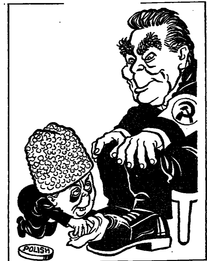
رسم كاريكاتوري في صحيفة «المنادي» الكويتية يظهر فيه ولسون وهو يصيح خشناً ببريطانيا...